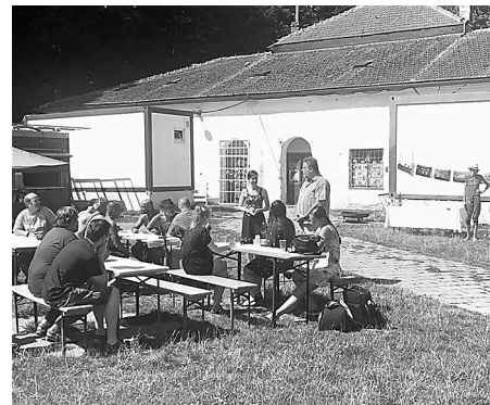
Diecézní charita Brno – Střelák

Ale musím uznat, že Střelák nás hodně naučil. Rychlému rozhodování v krizi a pod tlakem, spolupráci s různými neziskovými i občanskými a dobrovolnými